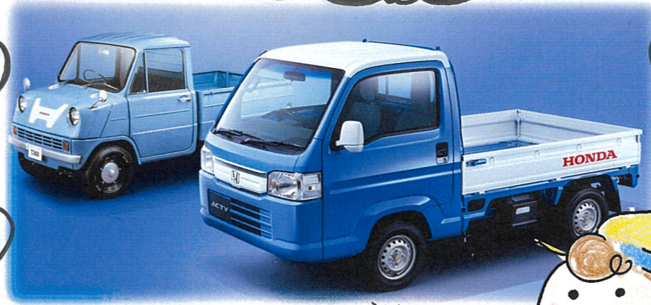
※ダウンスピリットカラースタイル(2トントラック)は既に生産終了しております