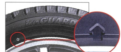
プラットホームの目印(↑)