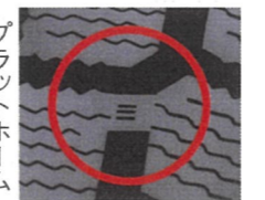
残り溝50% 残り溝が新品時の50%になったら交換の時期