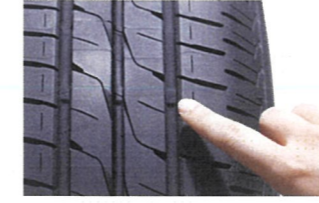
接地面に現れるスリップサイン

② 溝の深さは十分ですか? 溝が減っていると排水性が低下し、スリップしやすく危険です! 乗用車用タイヤでは残り溝が1.6mm以下になると、スリップサインがタイヤの接地面に現れます。スリップサインが1箇所でも現れたタイヤで走行することは法律でも禁止されているので、新しいタイヤに交換しましょう。