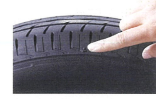
スリップサインの位置を示す「▲」マーク