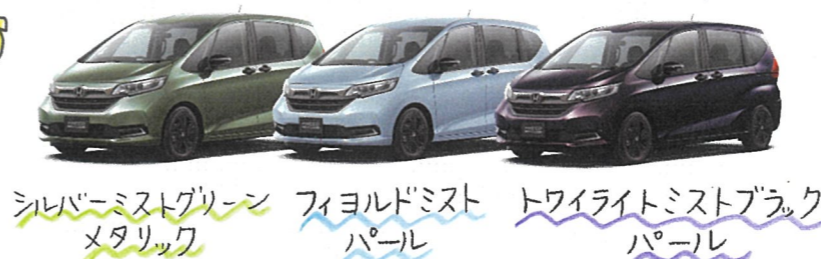
シルバーミストグリーンメタリック フィヨルドミストパール トワイライトミストブラックパール

※タイプ・グレードによって装備は異なります ※展示車・試乗車は各店舗によって異なります