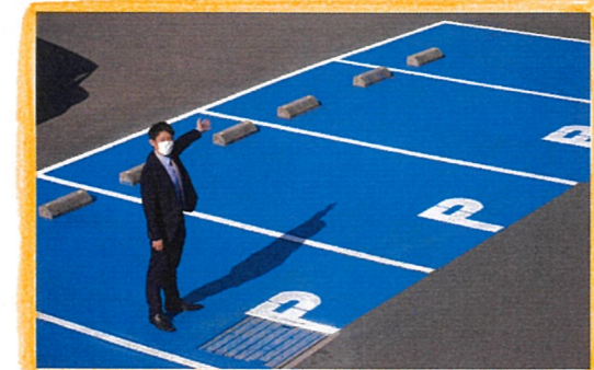
※ドローン撮影ではございません

今回は当店の魅力をちょこごと紹介いたします♪ なんといいても・・・ 駐車場が広く止めやすいです!! お客様用の駐車スペースは青く塗っています。 ご来店頂いた際には、ひと目で分かりやすいようになり、駐車スペースも幅に余裕を持たせてありますので、大変止めやすくなっています。