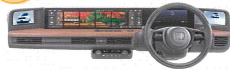
ワイドビジョンインストルメントパネル