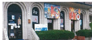
鳥取県境港市 昭和町 9-20 営業時間 7:00-15:00 (火曜日定休日 ※祝日も営業)