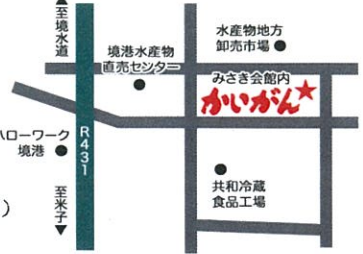
※ 駐車場 普通車30台、バス5台