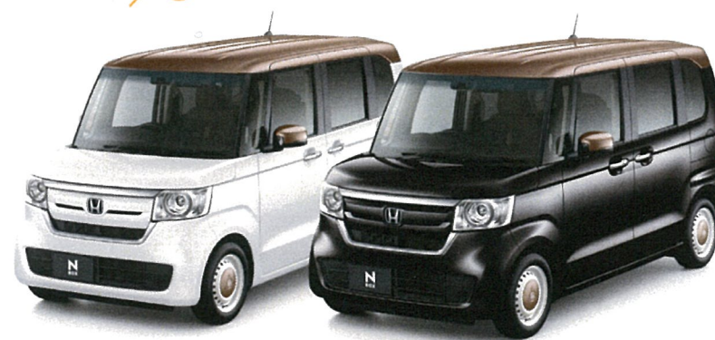
クリスタルホワイト