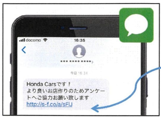
※スマホ・ガラケー 両方に対応